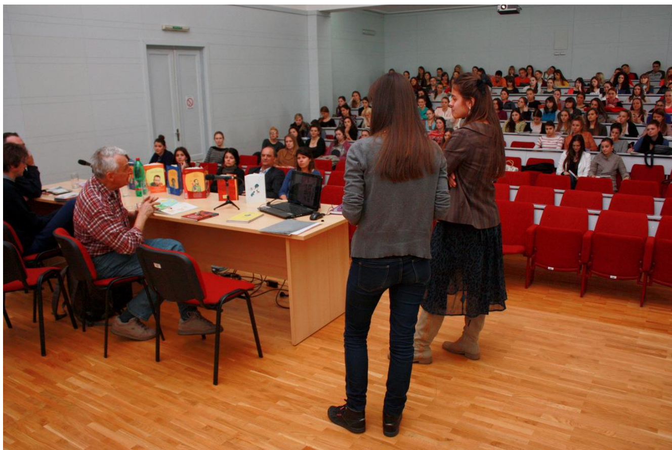
Дијалог студената и писаца