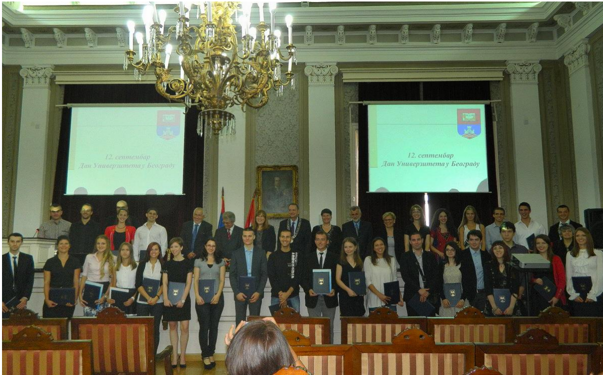
Најбољи студенти Универзитета у Београду у школској 2012/2013.