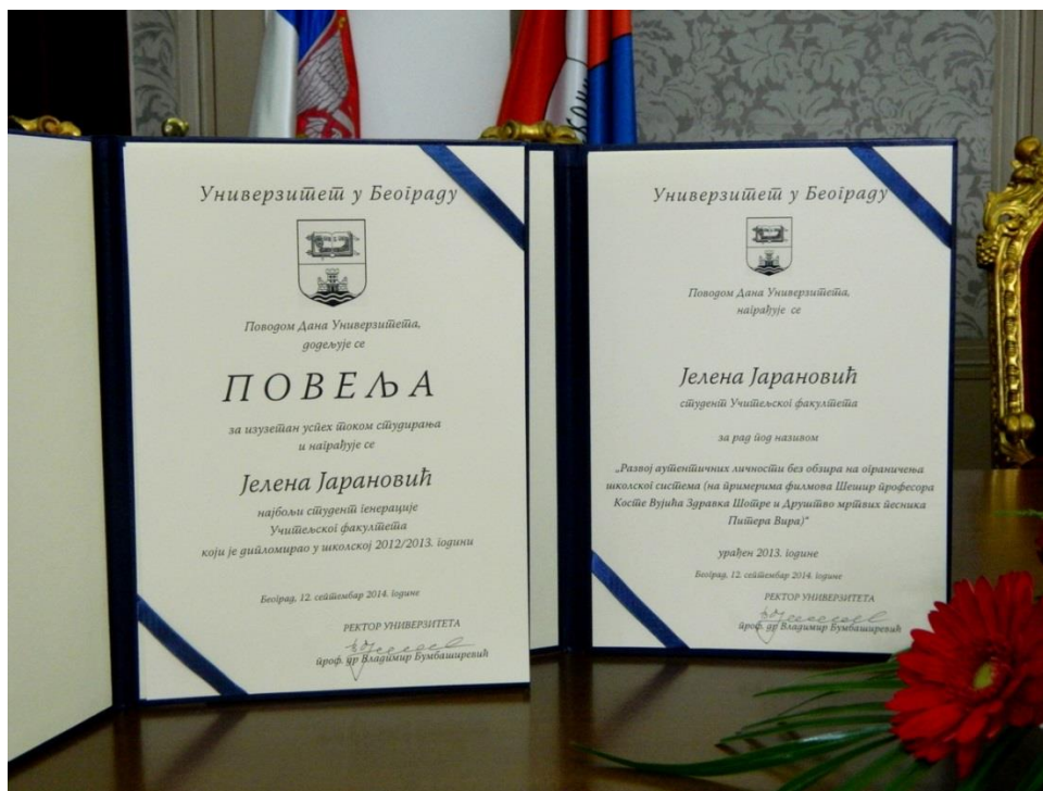
Повеља за студента генерације 2012/2013. и Награда за најбољи научноистраживачки рад