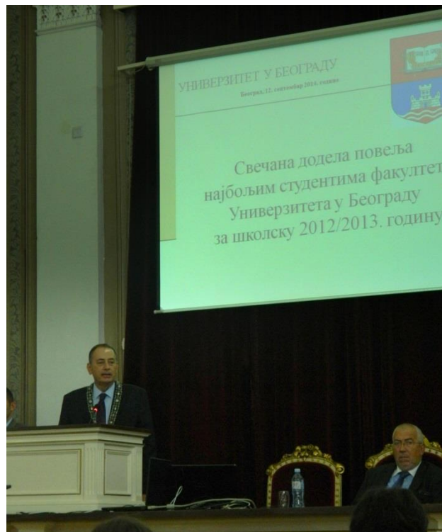
Ректор Универзитета у Београду на Свечаној додели признања најбољим студентима